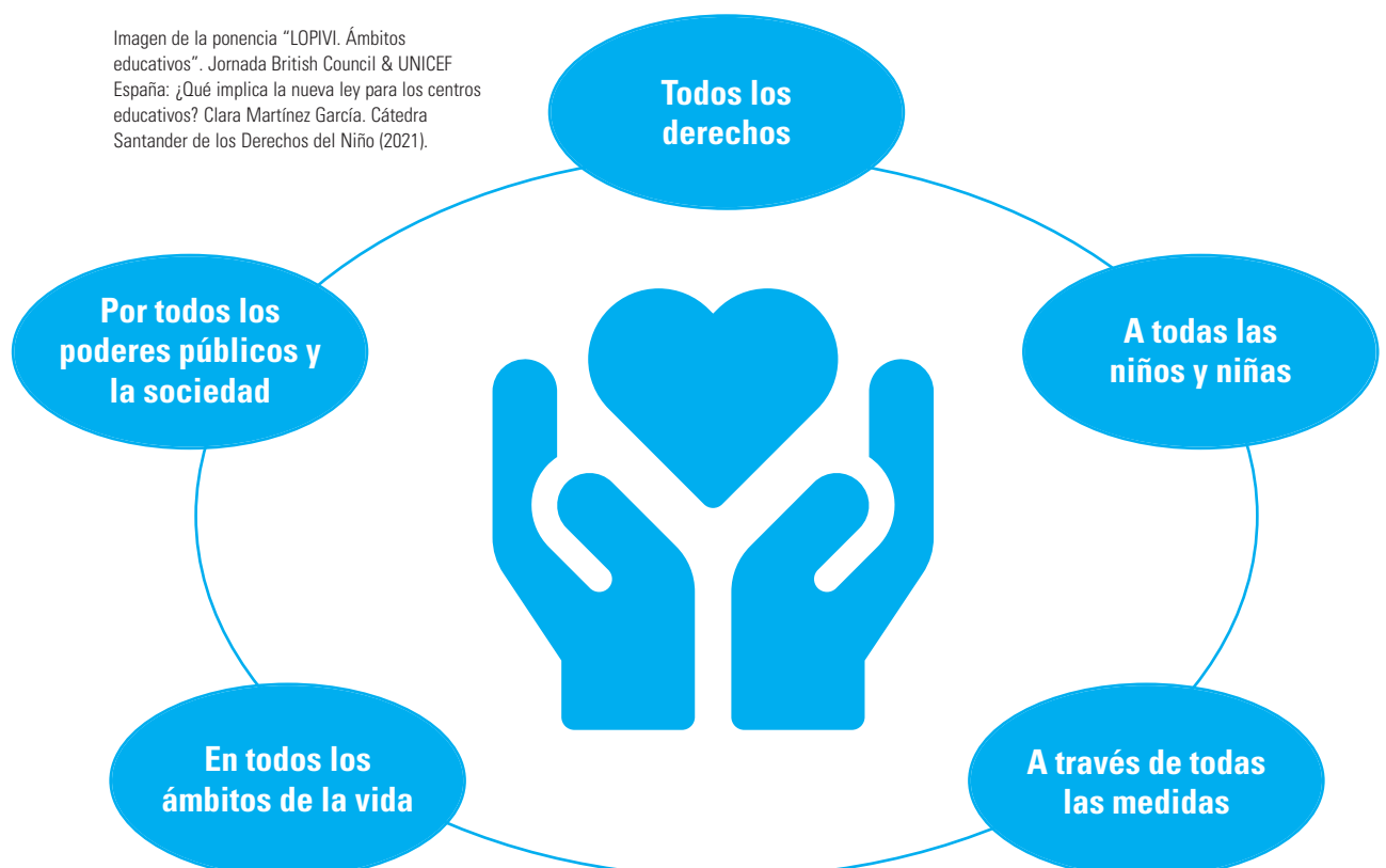
Figura 1. Enfoque de protección integral a la infancia frente a la violencia

implicación de todos los poderes públicos, todos los miembros de la comunidad educativa y, de modo más amplio, de toda la sociedad (Figura 1). La UNESCO lo denomina Whole School Approach , es decir: “abordar las necesidades de los alumnos, el personal y la comunidad en general, no solo dentro del plan de estudios, sino en toda la escuela y el entorno de aprendizaje. Implica una acción colectiva y colaborativa en y por una comunidad escolar para mejorar el aprendizaje, el comportamiento y el bienestar de los estudiantes, y las condiciones que los sustentan” (Organización de las Naciones Unidas para la Educación, la Ciencia y la Cultura [UNESCO], 2016).