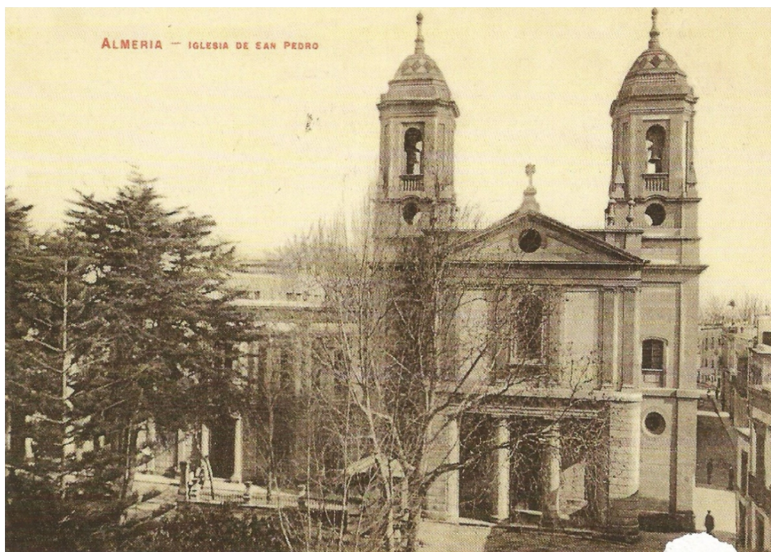
En esta céntrica plaza almeriense instaló Don Pantaleón su famosa escuela.

abriría la posibilidad de enriquecerse invirtiendo en la prometedora y floreciente minería almeriense, que se estaba desarrollando en Sierra Almagrera. Alentado por este halagüeño porvenir, el señor maestro se trasladó a Almería y abrió su escuela en los primeros meses de 1844, en un caserón de la Plaza de San Pedro, con un resultado muy alentador pues muy pronto fue valorada como la mejor de las de su clase.