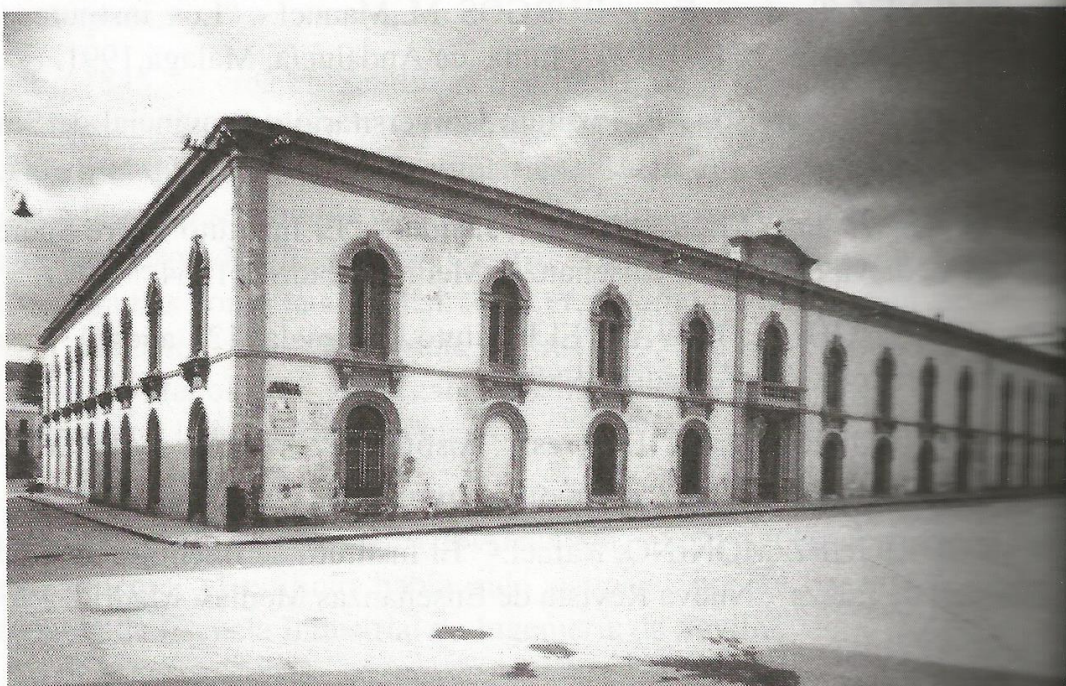
Fachada principal del convento de dominicos que fue sede del Colegio de Humanidades.

Quizás por tener su sede en el extinto convento de Santo Domingo se llamó de Santo Tomás, recordando al insigne teólogo dominico. Su primer claustro estaba formado por 8 profesores y un regente de estudios y admitía alumnos internos, externos y mediopensionistas. Inició sus actividades con 17 alumnos, de ellos 9 internos, 4 mediopensionistas, pero su número fue rápidamente en aumento y dos años más tarde ya contaba con 80 alumnos, 24 internos, 7 mediopensionistas, 34 externos, 12 párvulos y tres finalistas de los estudios de Comercio. Dado que el Colegio atendía desde la enseñanza de las primeras letras hasta los estudios de Filosofía, entendemos que habría una gran disparidad de edades entre los alumnos, conviviendo desde los más pequeños a los adolescentes y jóvenes más crecidos. Para su gobierno, además del director y profesores, el Colegio contaba con dos porteros, uno para cada piso, un “silenciario” para mantener el orden y velar durante la noche, una señora para las labores de limpieza y el personal de cocina.