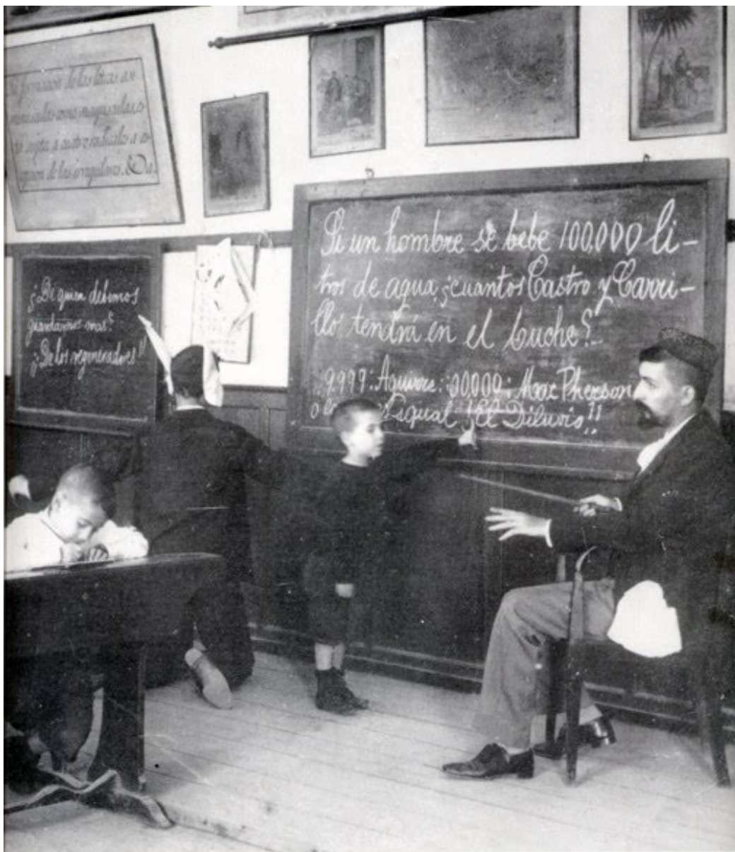
Grabado donde se puede apreciar a un alumno castigado a llevar sobre la cabeza el casquete con las orejas de burro.

En cualquier caso, bondadoso o cruel, Don Pantaleón debió poseer una vasta cultura y sería un eficiente maestro. Mereció que de él se dijera “Noble calígrafo y sabio maestro, educador de toda la juventud de su época a quien enseñó las formas de trato y expresión distinguida, correcto en el vestir y en la palabra, dejó numerosos alumnos...” 10 Sus discípulos no solamente aprendían los rudimentos de la lectura y escritura, nociones de Doctrina Cristiana, Historia Sagrada, Gramática, Aritmética y Urbanidad, sino que también