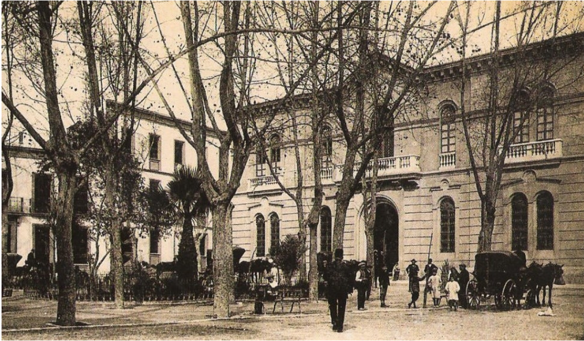
Plaza de la catedral, con el edificio del Seminario a la izquierda.

Estos colegiales-acólitos recibían instrucción eclesiástica, clases de canto, Latín y Gramática. Las clases se impartían en dependencias de la misma catedral y la asistencia a las mismas estaba abierta a quien quisiera libremente asistir. Para facilitar esta instrucción parece que existía en aquel tiempo una Librería, que disponía de una colección de clásicos latinos y algunos otros. En las Actas del Cabildo se puede conocer tanto los títulos de los libros que componían esta librería como el nombramiento de los preceptores hasta la fundación del Seminario. Una vez fundado este, el Cabildo continuó colaborando con la Ciudad en el sostenimiento para los seculares de la escuela de primeras letras y Gramática. En aquel tiempo, como en el de hoy, parece que los maestros no gozaban de gran reconocimiento social y en ocasiones eran tan pobres que había que enterrarlos de balde. Prueba de esta subestima de la actividad docente es el hecho de que el maestro recibía entonces por su labor la mitad de lo que percibían los oficios más humildes de la catedral como el pertiguero o el campanero.