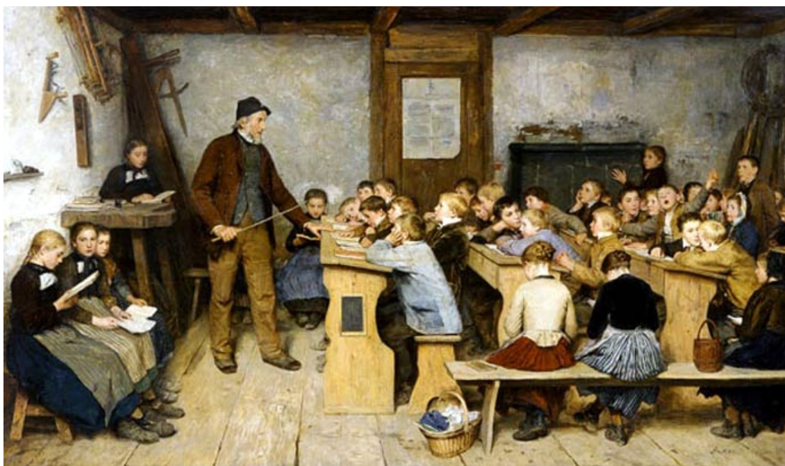
Grabado representativo de una escuela unitaria típica de finales del siglo XIX

Según Madoz, antes de la creación del Instituto Almería se caracterizaba por un acusado abandono en lo referente a la enseñanza. En la capital había 12 escuelas de Primera Enseñanza, siete de niños en las que se enseñaba a leer, escribir y los rudimentos de la Gramática y Aritmética y cinco para niñas, a las que, además de las labores, que entonces llamaban propias de su sexo, se les instruía en la Lectura, Escritura y las cuatro primeras reglas de contar.